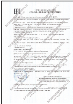
CU-TR符合性声明 ( CU-TR DOC )

海关联盟认证Custom Union Technical Regulation Certification, 又称海关联盟技术规范认证, 其认证标志为EAC, 因此英文简称CU-TR认证或EAC认证。